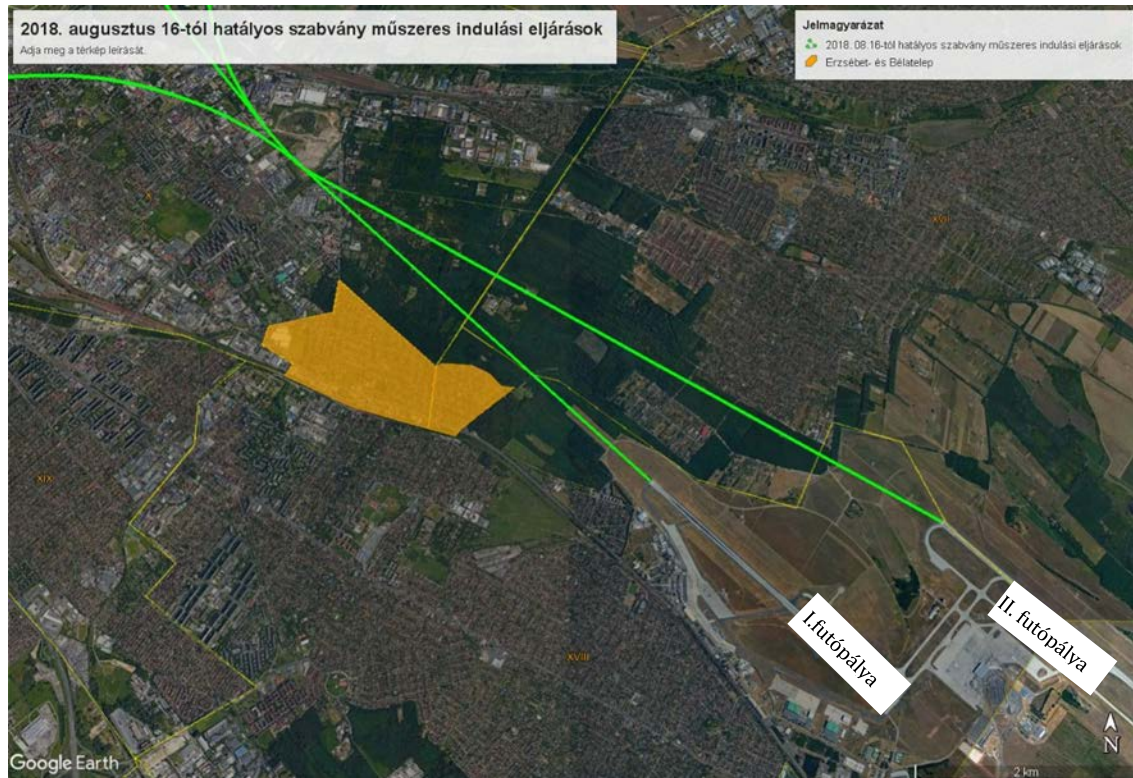
3. ábra 2018. 08.16-tól hatályos szabvány műszeres indulási eljárás (SID)