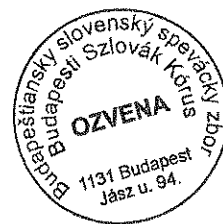
Hollósy Tiborné elnök

Budapest XVIII. kerületi Szlovák Nemzetiségi Önkormányzat