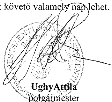
Ughy Attila polgármester

A rendelet kihirdetésének dátuma: 2016. március 1.