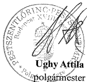
Ughy Attila polgármester

A rendelet kihirdetésének dátuma: 2015. március 24.