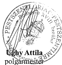
Ughy Attila polgármester

A rendelet kihirdetésének dátuma: 2015. február 25.