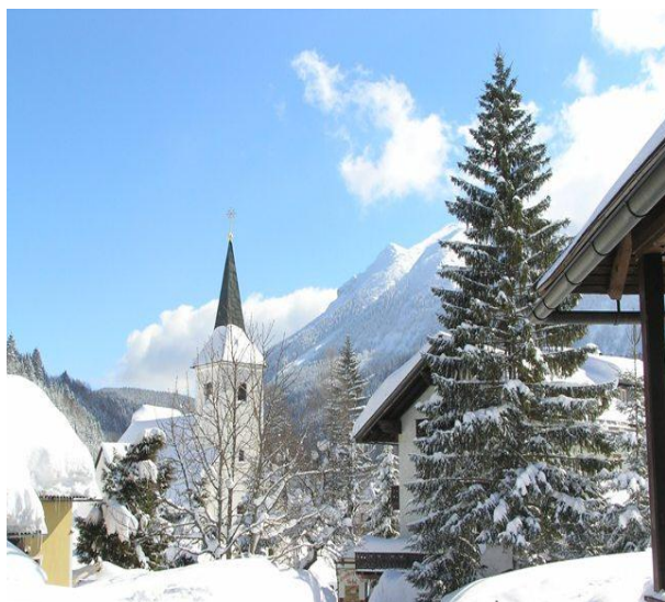
Szállás Sporthotel, Lackenhof Pályaszállás, ülőszékes felvonótól 100m-re

2012. március 15-18. csütörtöktől vasárnapig Lőrinc Kupa Síverseny márc. 17-én