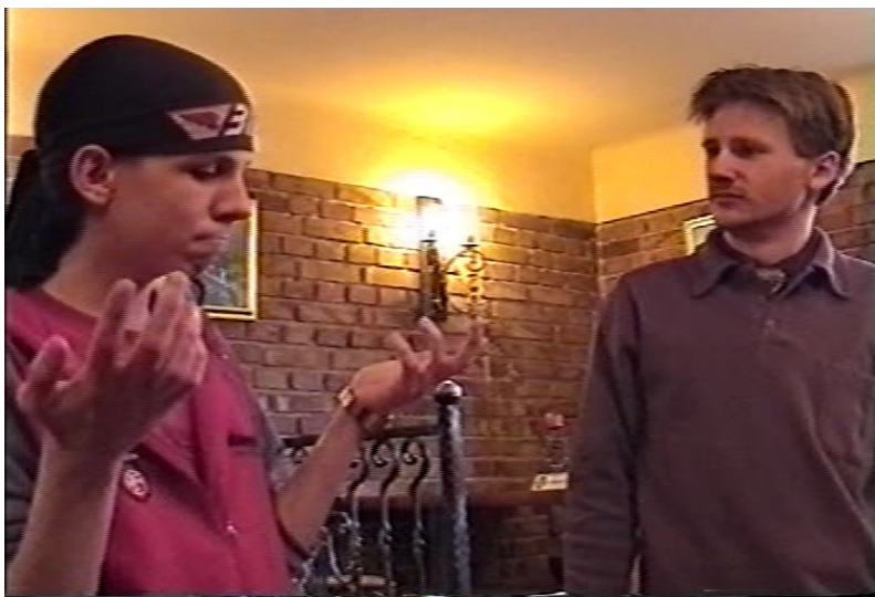
Mindenkinek Dzsaszper kell (Hát igen...ez világszám!)