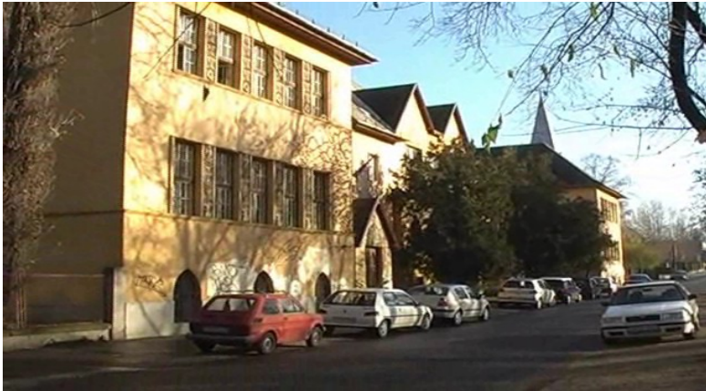
Iskola a város szívében Garai Gábor filmje a Hunyadi Mátyás Gimnázium történetéről a színjátszó szakkörösök közreműködésével