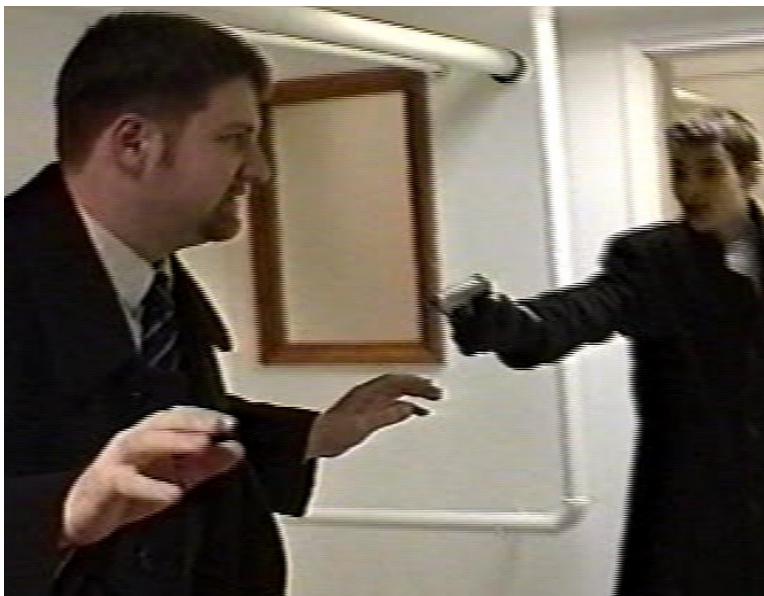
Mindenkinek Dzsaszper kell (Dzsaszper kiszabadítása)