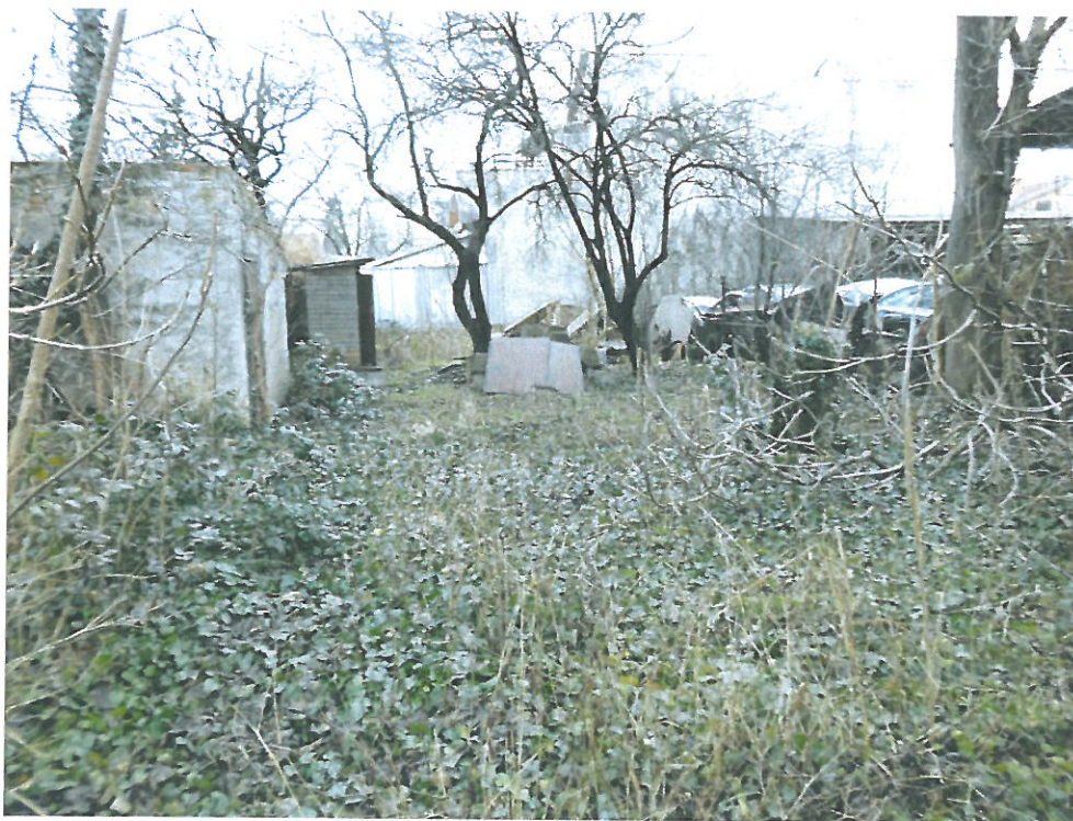
Rendezetlen, szeméttel terhelt kert