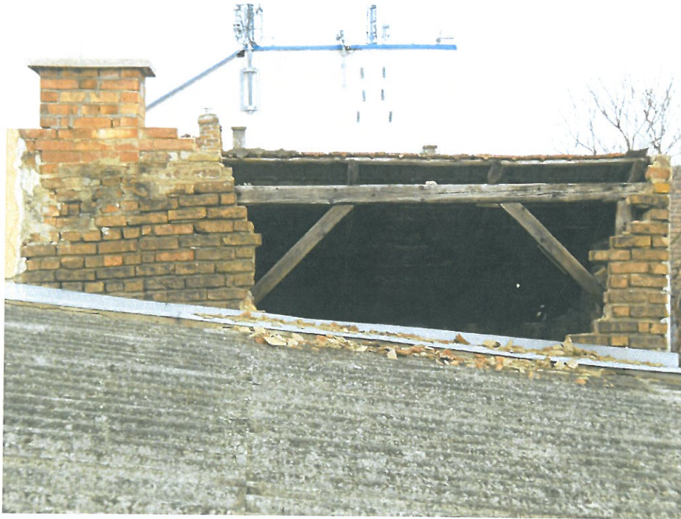
Az épület tűzfala beomlott