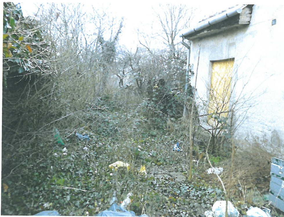
Szanálásra ítélt épület