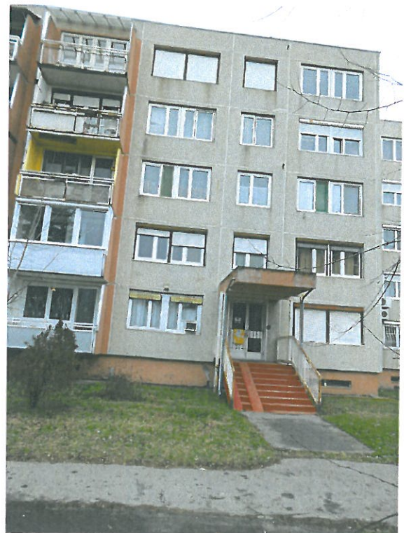
Lépcsőházi bejárat az utca, illetve a belső park felől