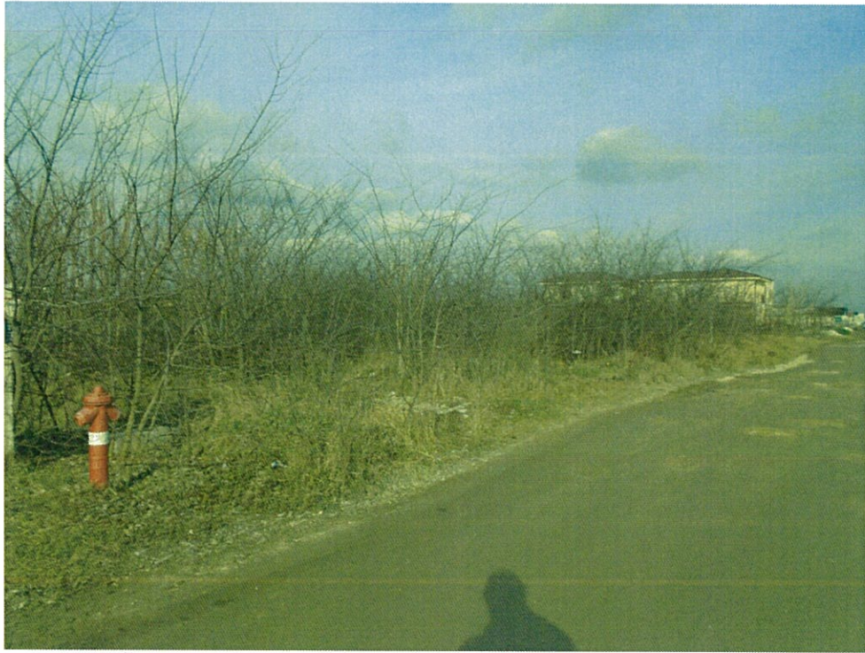
Az ingatlan a Határ utcától földúton közelíthető meg