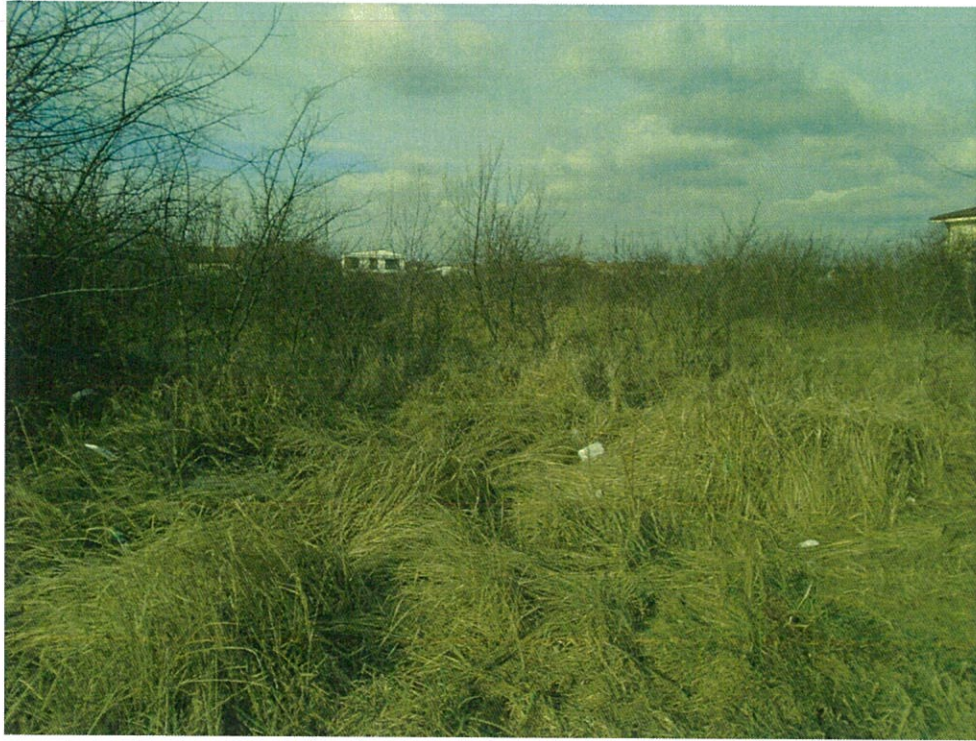
Újonnan parcellázott terület, a telekre a vízbekötés megtörtént