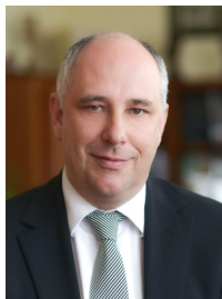
Ughy Attila polgármester