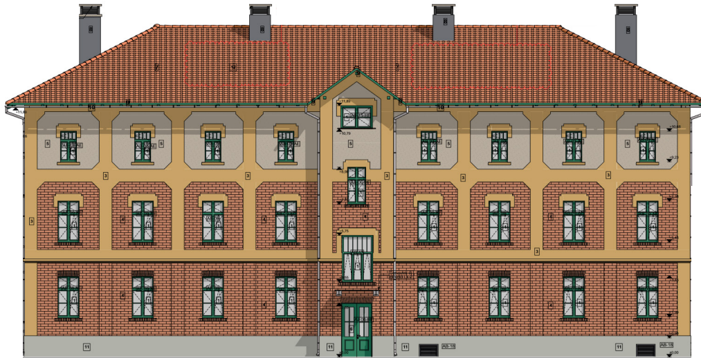
A Fáy u. 2. „C” lépcsőház látványterve