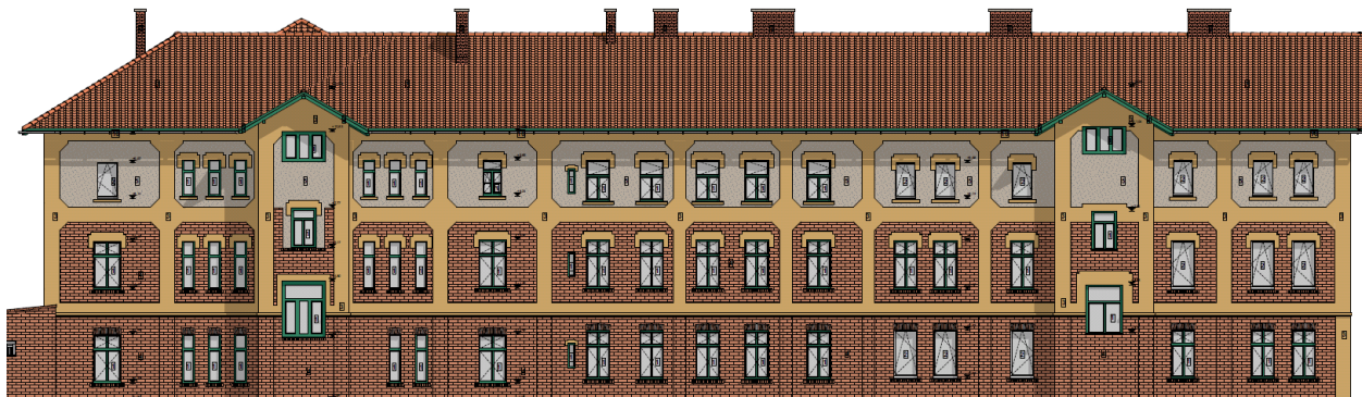
A Fáy u. 2. „A-B” lépcsőház látványterve