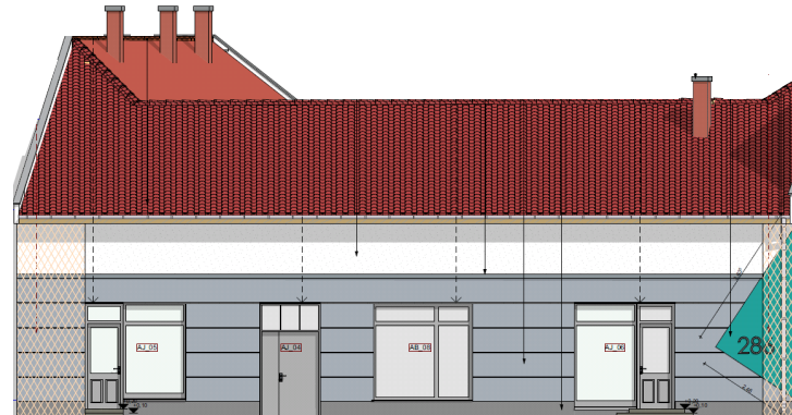
Az Üllői út 286. látványterve