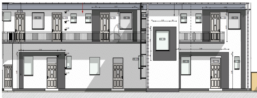
Az Üllői út 317. tervezett belső DNy-i homlokzata