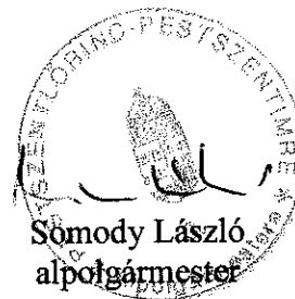
Sömody László alpolgármester

Az előterjesztés összhangban van a jogszabályokkal: