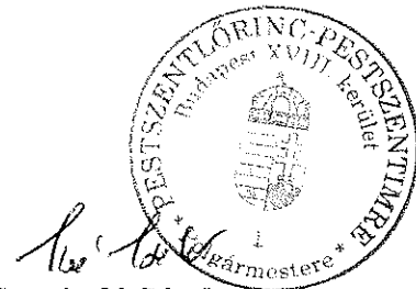
Szaniszló Sándor polgármester