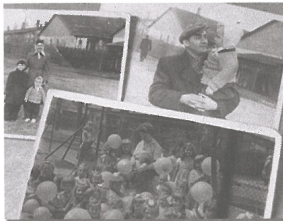
Mint egy nagy falu