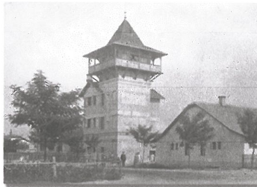
A víztornyó. Nagyításhoz kattints a képre!