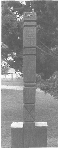
Órvidék TRIANON Emlékoszlopa, csak példaként, mint leendő térbeli elhelyezkedésre

Helyszín: Szélmalom u. – Margó T. u. – Baross u. határolta köztér