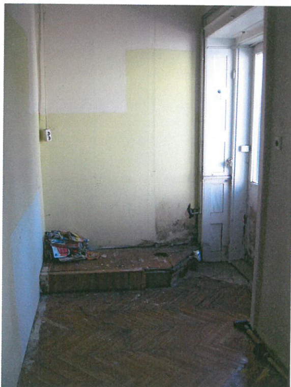
Előszoba a hátsó bejáratnál