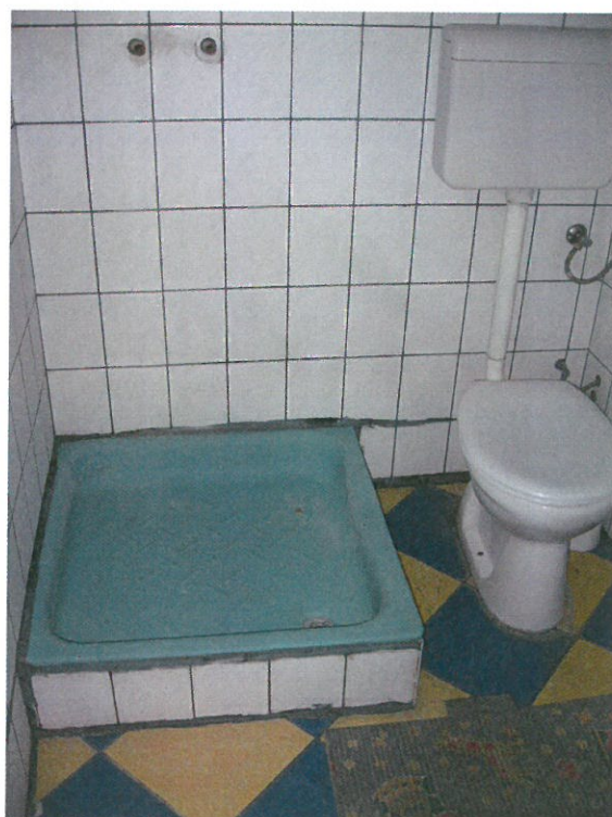
Zuhanyzó + WC