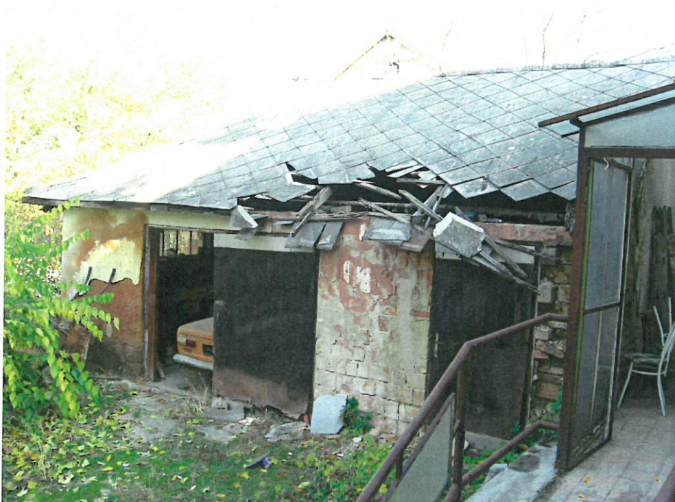
Romos állapotú melléképület